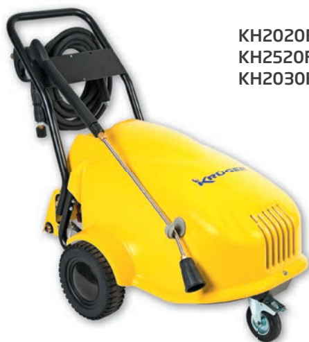
KH2020F KH2520F KH2030F